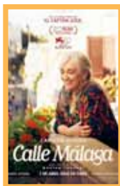
Calle Málaga (116 min.) Sábado 6: 18:00 - 20:15 h. Martes 9: 18:00 - 20:15 h. Precio: 6,00€