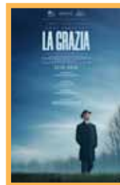
La Grazia (133 min.) Sábado 27: 20:15 h. Domingo 28: 17:45 h. Lunes 29: 17:45 h. Precio: 6,00€