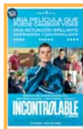
Incontrolable (120 min.) Sábado 27: 18:00 h. Domingo 28: 20:15 h. Lunes 29: 20:15 h. Precio: 6,00€