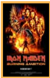
Iron Maiden: Burning Ambition (106 min.) Viernes 5: 20:15 h. Precio: 6,00€