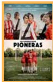
Pioneras (106 min.) Sábado 20: 18:00 h. Domingo 21: 20:00 h. Lunes 22: 18:00 h. Martes 23: 20:15 h. Precio: 6,00€