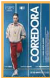
Corredora (96 min.) Sábado 13: 20:00 h. Domingo 14: 18:00 h. Lunes 15: 20:15 h. Martes 16: 18:00 h. Precio: 6,00€