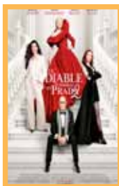
El diablo viste de Prada 2 (120 min.) Domingo 7: 18:00 - 20:15 h. Lunes 8: 18:00 - 20:15 h. Precio: 6,00€