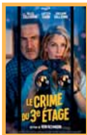
Asesino en la 3ª planta (104 min.) Sábado 20: 20:00 h. Domingo 21: 18:00 h. Lunes 22: 20:15 h. Martes 23: 18:00 h. Precio: 6,00€