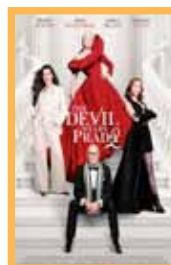
El Diablo viste de Prada 2 (120 min.) Sábado 30: 20:00 h, Domingo 31: 20:00 h. Lunes 1: 18:00 h. Martes 2: 20:00 h Vose. Precio: 6,00€