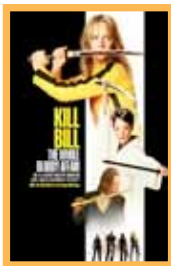
Kill Bill: The whole bloody affair (275 min.) Viernes 1: 19:15 h. Vose Sábado 2: 19:15 h. Precio: 6,00€