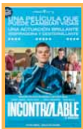
Incontrolable (120 min.) Domingo 3: 18:00 - 20:15 h. Lunes 4: 18:00 - 20:15 h Martes 5: 18:00 - 20:15 h Vose Precio: 6,00€