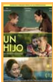
Un hijo (94 min.) Sábado 30: 18:00 h, Domingo 31: 18:00 h. Lunes 1: 20:15 h. Martes 2: 18:00 h Precio: 6,00€