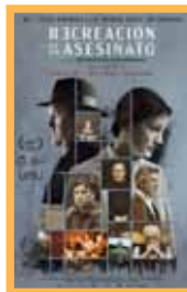
Recreación de un asesinato Sábado 23: 18:00 h. Domingo 24: 20:00 h. Lunes 25: 18:00 h. Martes 26: 20:15 h. Vose Precio: 6,00€ (98 min.)