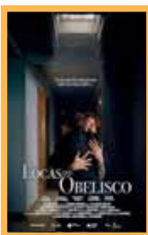
Las locas del obelisco Miércoles 6: 18:00-20:00. Precio: 6,00€ (98 min.)