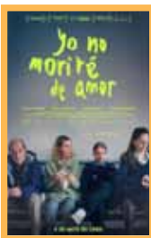
Yo no moriré de amor (94 min.) Sábado 23: 20:00 h, Domingo 24: 18:00 h. Lunes 25: 20:15 h. Martes 26: 18:00 h. Precio: 6,00€