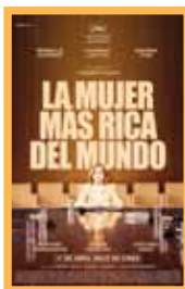
La mujer más rica del mundo (121 min.) Sábado 9: 20:00 h, Domingo 10: 20:00 h. Lunes 11: 18:00- 20:15 h. Martes 12: 18:00-20:15 h. Vose Precio: 6,00€